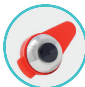
Nahtloch für Gewebe-Fixierung