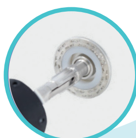
Einzigartig gehärtete Zerspanung Ring ermöglicht präzises Schneiden von Gewebe, was durch ein lautes Klickgeräusch, dem Operateur zusätzlich akustisch kenntlich gemacht wird.