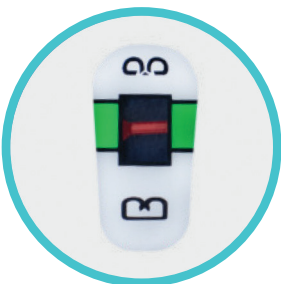
Sichtbare Anzeigemarken vereinfachen die Auslösung der Klammern in einem Bereich (Toleranz) zwischen 1,5 mm - 2,5 mm.