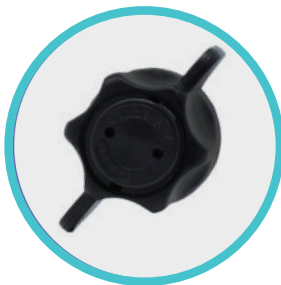
Einfacher Drehmechanismus Markierungen reduzieren die Chance auf eine Fehlbedienung